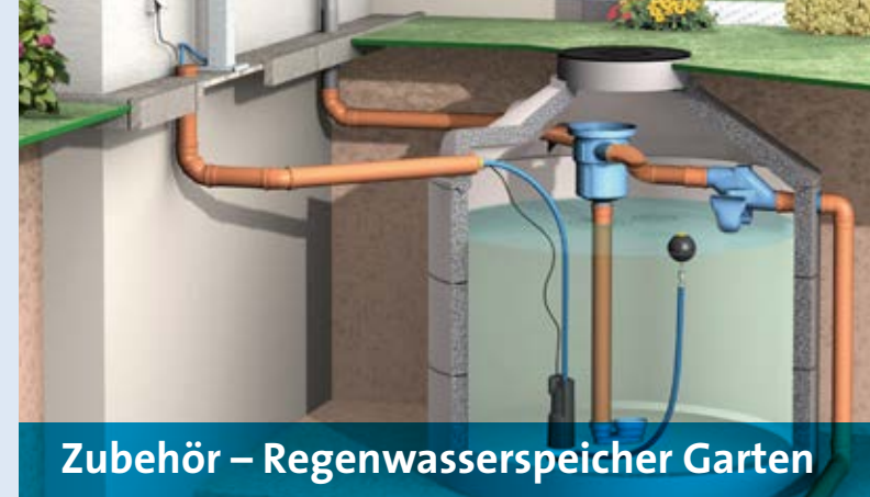
Zubehör – Regenwasserspeicher Garten