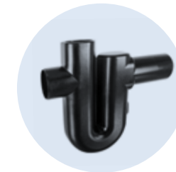
Überlaufsiphon DN 100

Der Kompaktfilter ist unkompliziert in der Wartung, er benötigt nur geringe Reinigungsintervalle. Das gereinigte Wasser kann für Waschmaschine, WC und Gartenbewässerung genutzt werden.