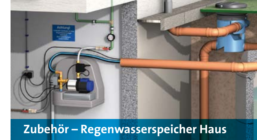
Zubehör – Regenwasserspeicher Haus