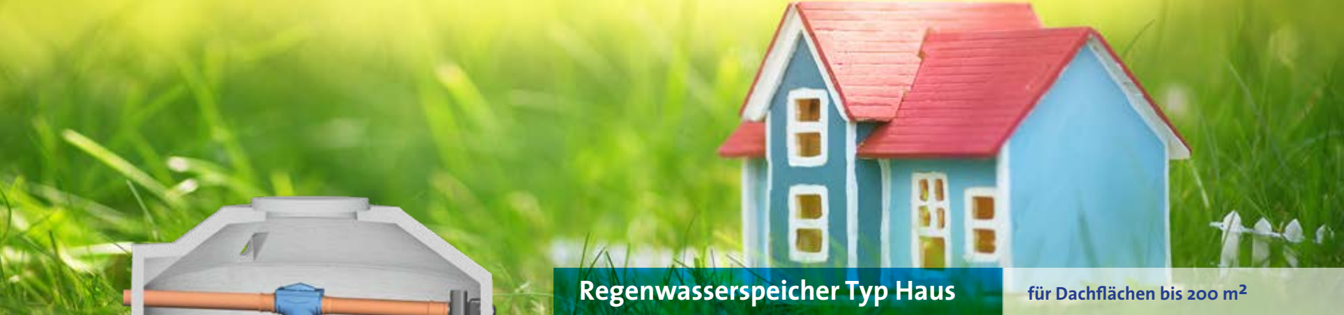
Regenwasserspeicher Typ Haus